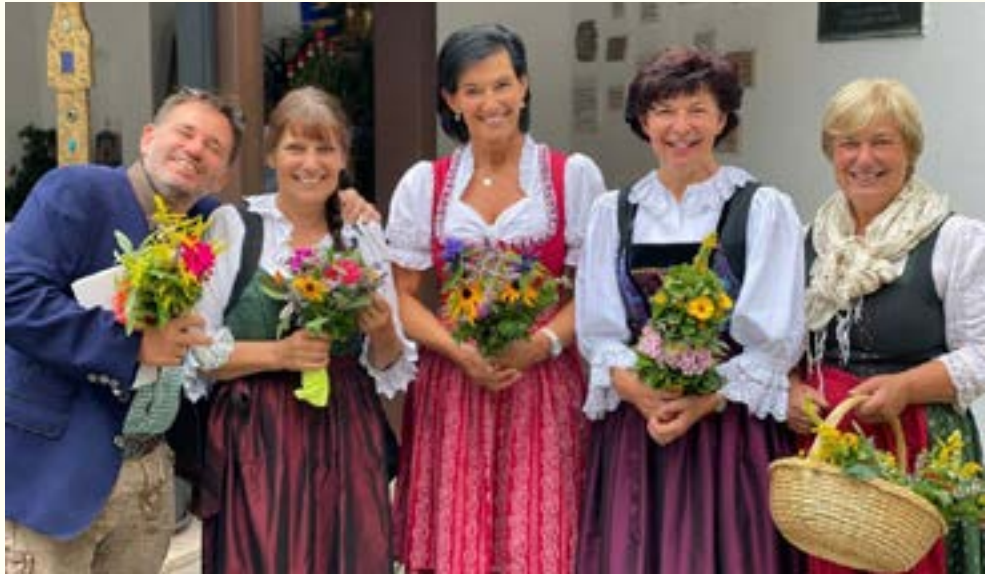
104. Gelöbniswahllfahrt des Kameradschaftbundes in Mariastein am 04.09.2022